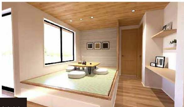
小上がり タタミ お子さまの遊び場や休憩スペース、 来客時の寝室などに使える小上がりタタミスペース。