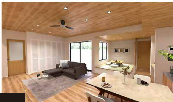
LDK 天井を高く確保した広々24帖。 木調で統一した柔らかな内装です。