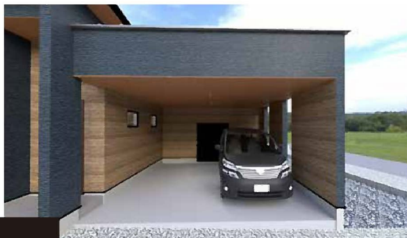
ガレージ 建物一体型のガレージ付き 雨の日の乗り降りも楽に行えます。