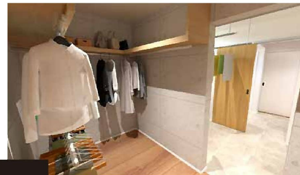
洗濯動線 お風呂場から洗面脱衣所、ランドリー、WIC、 寝室まで一直線のラクラク動線。