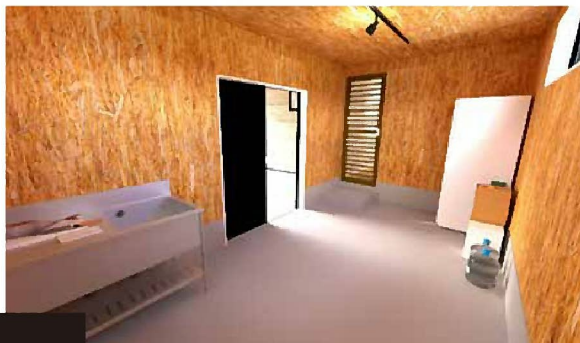
外部収納 釣りが趣味のお施主様こだわりの外部スペース。 魚を捌いたり、釣具やアウトドア用品の保管場所としても！