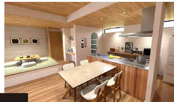
キッチン 無垢材で仕上げたキッチン。 アイランド型で回遊動線を確保しています。